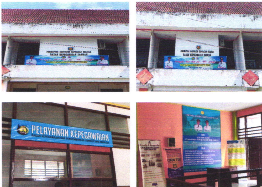
Gambar 1.1 FOTO KANTOR BADAN KEPEGAWAIAN DAN PENGEMBANGAN SUMBER DAYA MANUSIA

Kedudukan BKPSDM diatur dengan Peraturan Daerah Kabupaten Kepulauan Selayar Nomor 4 Tahun 2020 tentang Pembentukan dan Susunan Organisasi Perangkat Daerah dan Peraturan Bupati Kepulauan Selayar Nomor 141 Tahun 2021 tentang Kedudukan, Susunan Organisasi, Tugas dan Fungsi, serta Tata Kerja Badan Kepegawaian dan Pengembangan Sumber Daya Manusia Kabupaten Kepulauan Selayar.