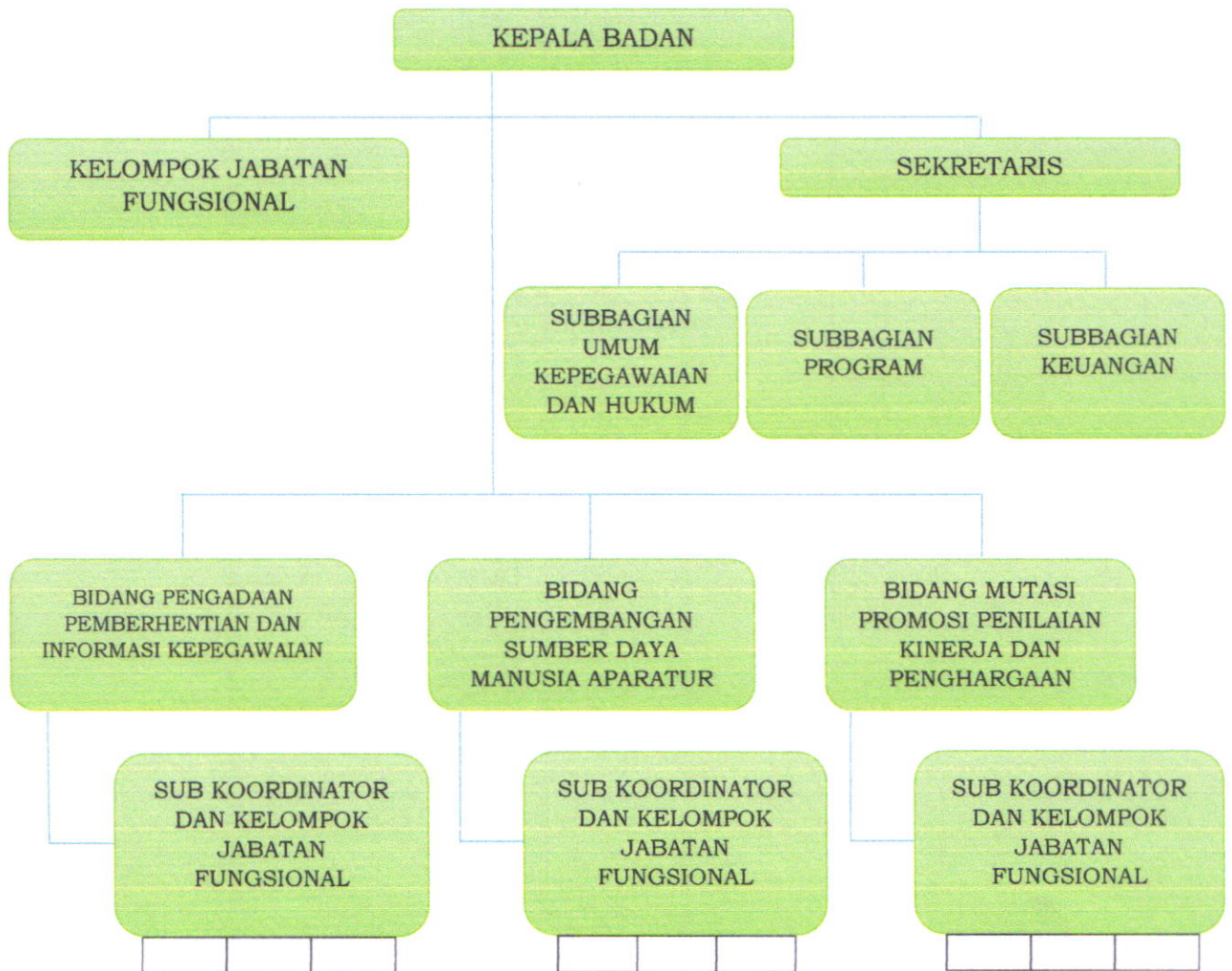
Gambar 1.2 STRUKTUR ORGANISASI BADAN KEPEGAWAIAN DAN PENGEMBANGAN SUMBER DAYA MANUSIA

Dalam bentuk bagan, Struktur Organisasi Badan Kepegawaian dan Pengembangan Sumber Daya Manusia Kabupaten Kepulauan Selayar dapat dilihat pada Gambar 1.2 :